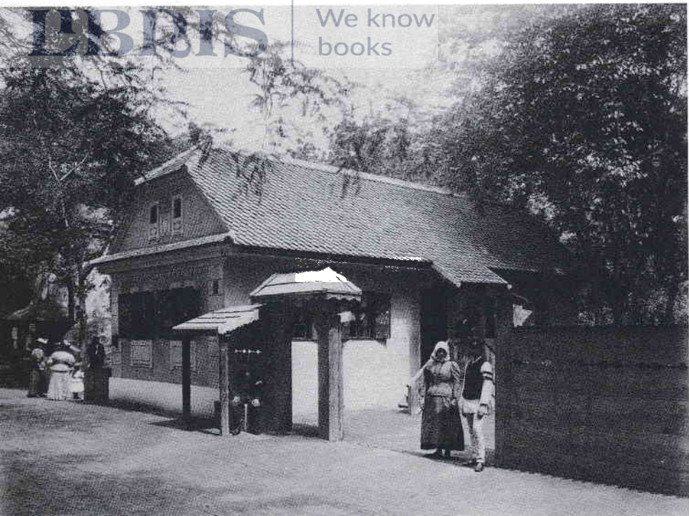
CSÁNGÓ HÁZ A MILLENNIUMI KIÁLLÍTÁSON, KLŐSZ GYÖRGY FÉNYKÉPE, 1896

A kiállítási épületek összköltsége meghaladta a 4,5 millió forintot, az emlékhelyek megépítésére pedig 5,2 milliót szántak.